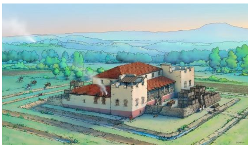
Abbildung 3 Rekonstruktionszeichnung der römischen Villa von Bodenbach

Und auch das liebevoll Amüsante und Kuriose kommt nicht zu kurz, das die Eifel doch ganz besonders auszeichnet.