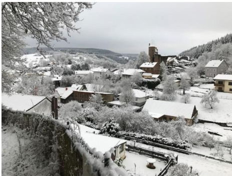
Abbildung 2

Ende Dezember finden in vielen Ortsgruppen des Eifelvereins Jahresabschlusswanderungen statt, bei denen auch Gäste herzlich willkommen sind.