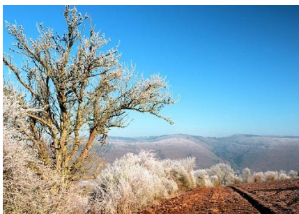
Abbildung 1 Abbildung 1

An den ruhigen Tagen "zwischen den Jahren" vom 27.12. bis 30.12.2022 laden die Ortsgruppen Fließem, Bettingen und Speicher gemeinsam mit dem Hauptwanderwart des Eifelvereins zum gemeinsamen Wandern zwischen den Feiertagen ein.